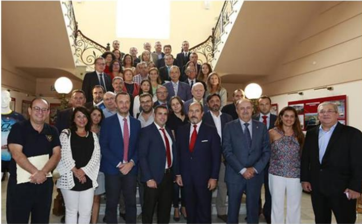
Participantes de la segunda jornada de la Red de Cátedras de RSC en Cartagena.